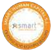
Certificado Blue Team

Como reconocimiento, otorgamos sellos de certificación en función de las diferentes áreas de trabajo: